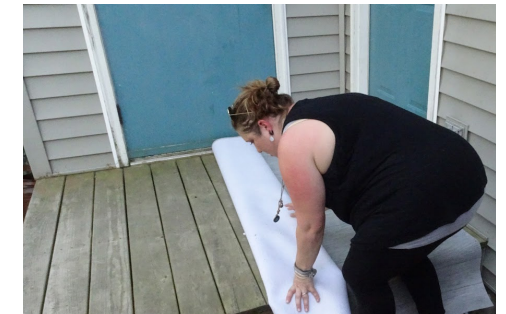
Measure, layout and cut to length