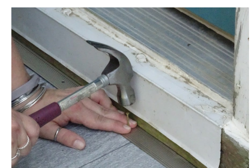
Use termination strips to hold down the edges and secure it to the surface