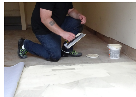
Trowel the adhesive smooth and roll back the material onto the adhesive. Be sure adhesive reaches the edges