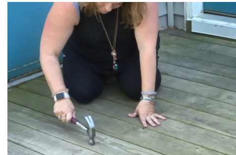
Ensure your surface is clean and structurally sound. Hammer or screw down any surface protrusions